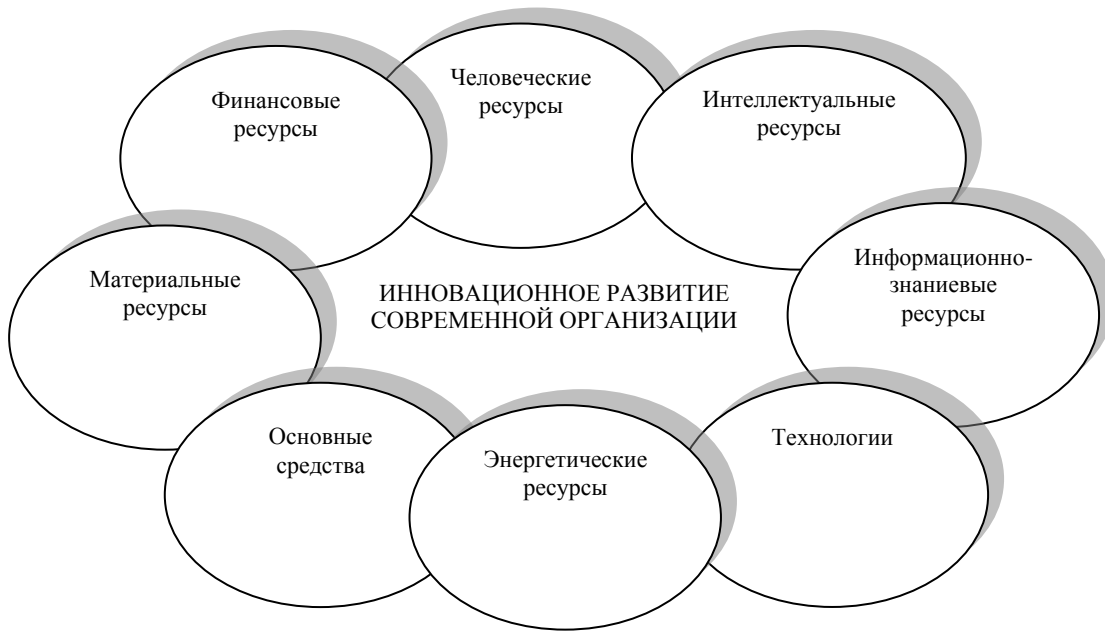
Рис. 2. Ресурсная составляющая инновационного развития современной организации

уделяется качественным характеристикам работников, их способностям мобильно реагировать на изменяющиеся условия внутренней и внешней среды, выдвигать эффективные идеи, принимать экономически обоснованные управленческие решения [17].