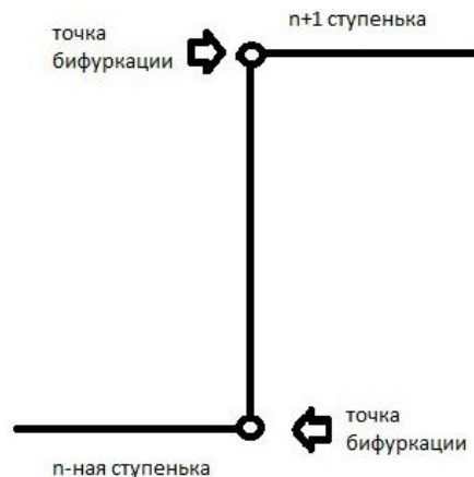
Рис. 1. Ступенька развития

поля коллективным бессознательным. В нашей модели АГОЛМ – это окончательное состояние предыдущей ступеньки развития сознания человека «n-1», оно показано на рисунке 1. Разрез эволюционного конуса с четырьмя этапами эволюционной изменчивости сознательного схематично изображен на рисунке 2.